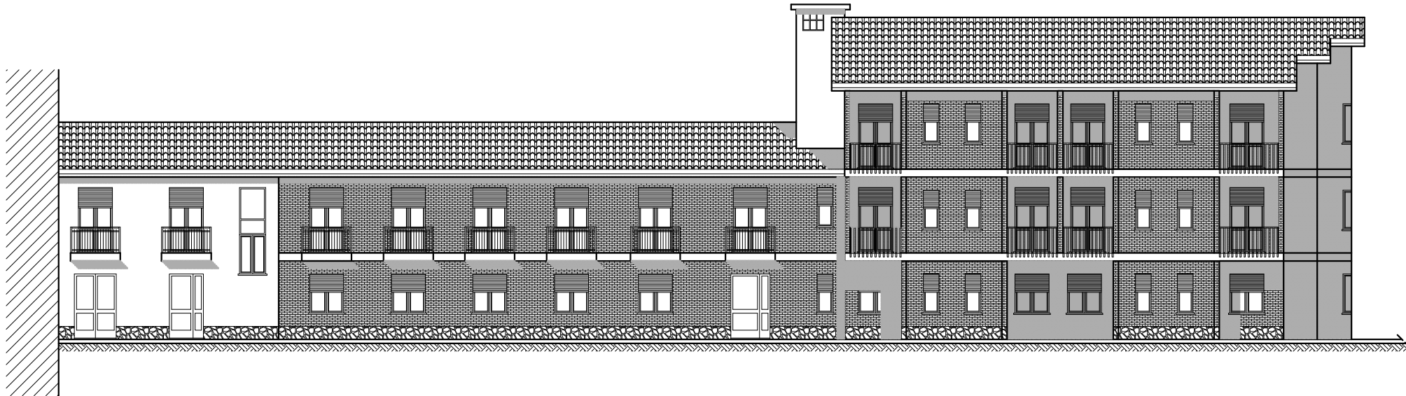
Retro-prospetto "Boero nuovo"